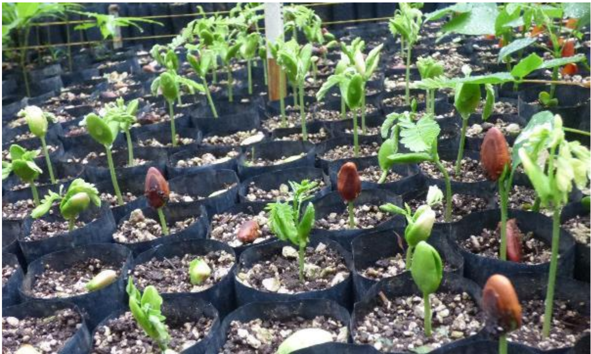
Ilustración 20. Técnica de siembra directa en bolsa con semillas de E. cyclocarpum .