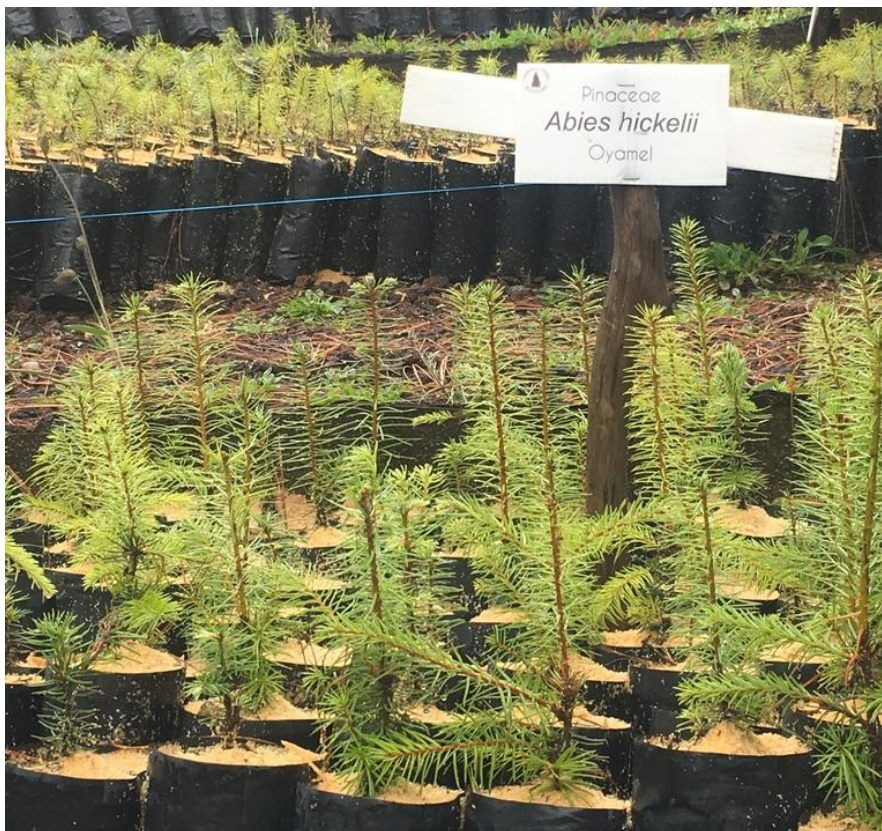
Ilustración 30. Plántulas de A. hickelii .

Esta especie nunca fue propagada en el Vivero BMM, pero segundo la literatura disponible se sabe que normalmente necesita un periodo de estratificación fría para quebrar la latencia fisiológica, o se puede utilizar técnicas de cebado de semillas para estimular la germinación (Zulueta-Rodríguez et al., 2015). La Ilustración 30 enseña las plántulas de A. hickelii propagadas en otro vivero.