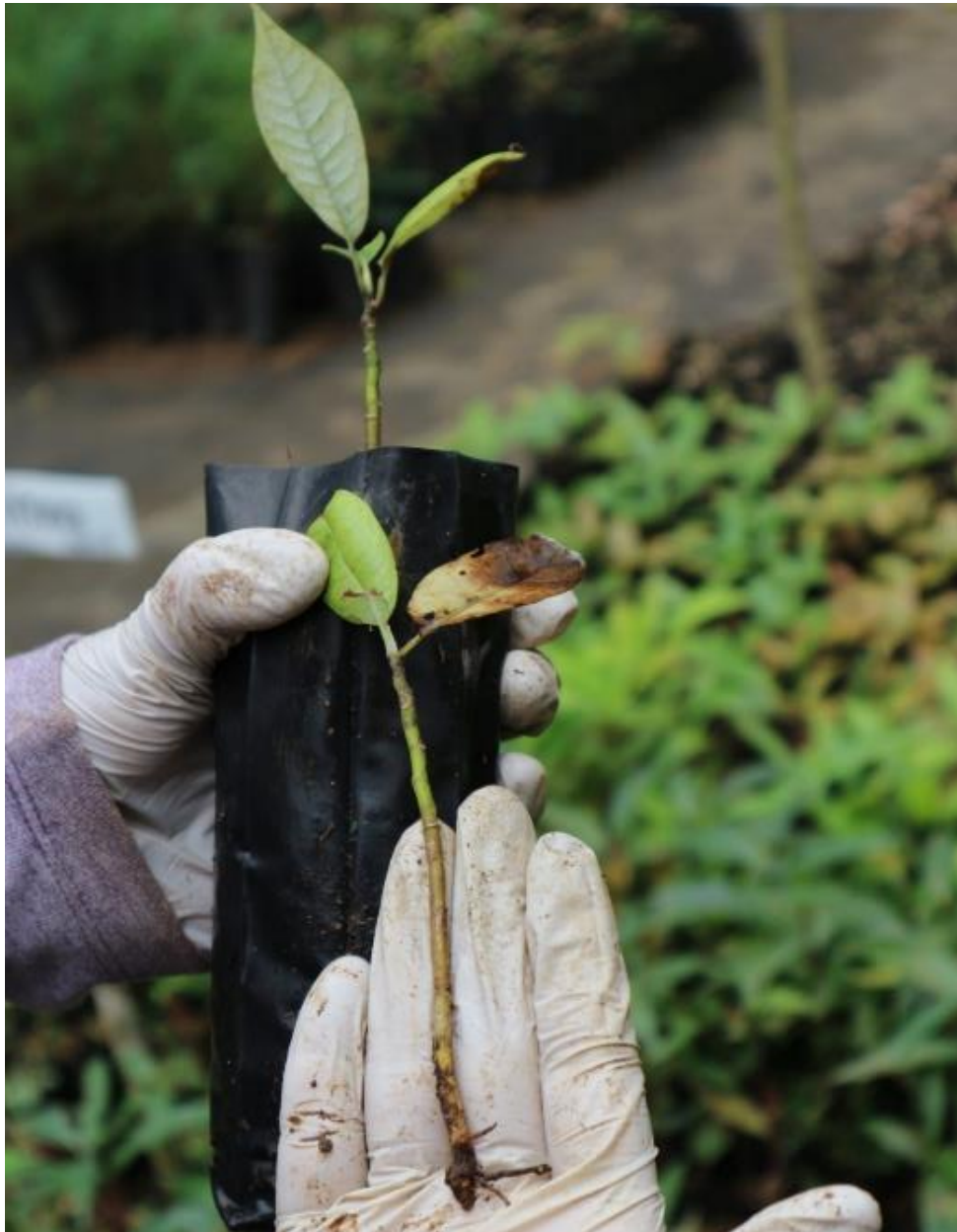
Ilustración 26. Problema de exceso de humedad en una plántula recién trasplantada de Magnolia dealbata Zucc., que muestra un tallo visiblemente deteriorado.

sensibles cómo Cedrela odorata L. ('cedro rojo'); Crataegus mexicana Moc. & Sessé ex DC. ('tejocote'); Hesperocyparis benthamii (Endl.) Bartel. (ex Cupressus benthamii Endl.; 'teotlate'); Dendropanax arboreus (L.) Decne. & Planch. ('zapotillo'); Hampea integerrima Schltld. ('jonote blanco'); I. inicuil ('jinicuil'); Inga vera Willd. ('chalahuite'); Meliosma alba (Schltld.) Walp. ('palo blanco'); Psidium guajava L. ('guajabo'); Spondias mombin L. ('jobo'); T. stans ('algodoncillo').