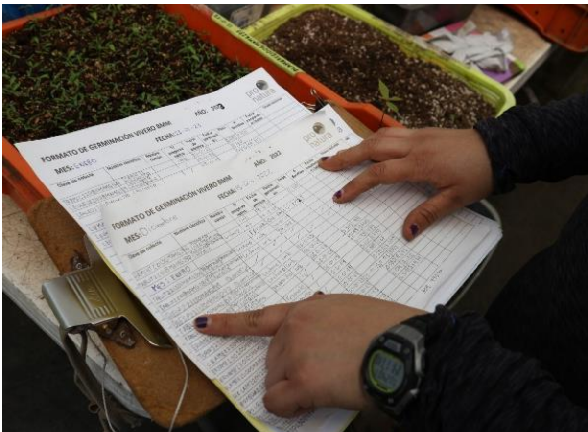
Ilustración 8. Ejemplo de un tipo de formato del Vivero BMM para registrar información sobre las semillas sembradas: clave de colecta; nombre científico; nombre común; tratamiento pre-germinativo; fecha de siembra; fecha de germinación; peso del lote de semillas; número de semillas; fecha de trasplante.