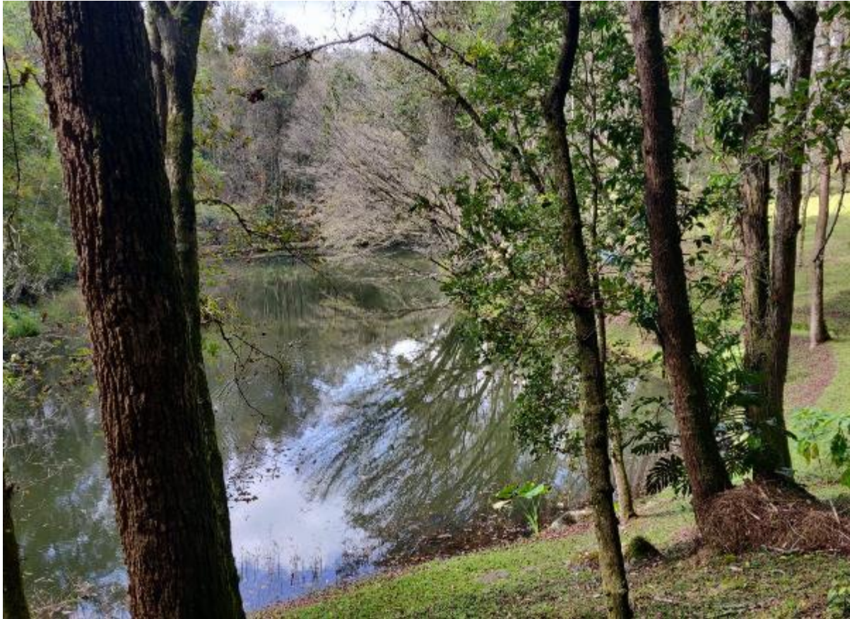
Ilustración 2. Lago artificial al pie del cerro donde se encuentra el Vivero BMM.