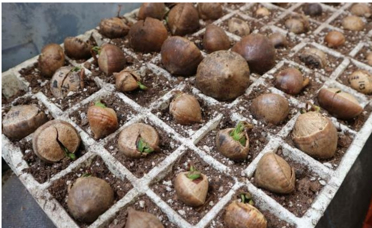
Ilustración 13. Semillas germinadas de Q. insignis .