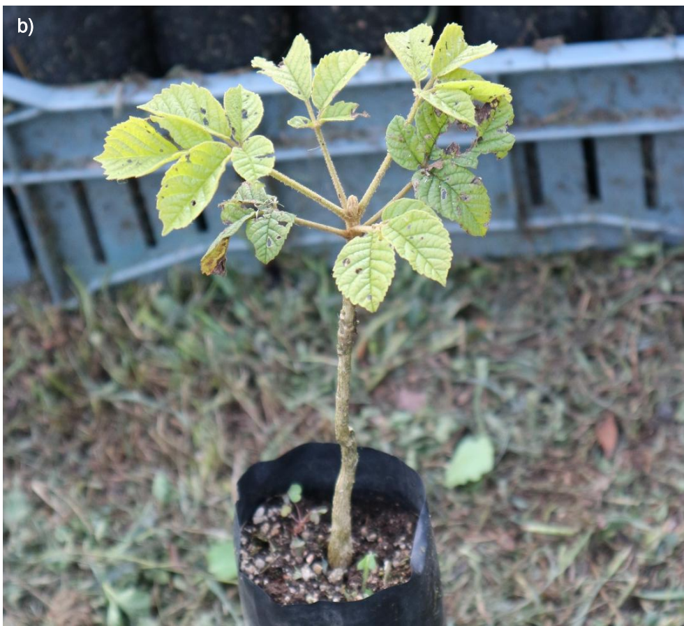
Ilustración 35. Plántulas de H. chrysanthus .: a) plántulas poco desarrolladas; b) plántula desarrollada.