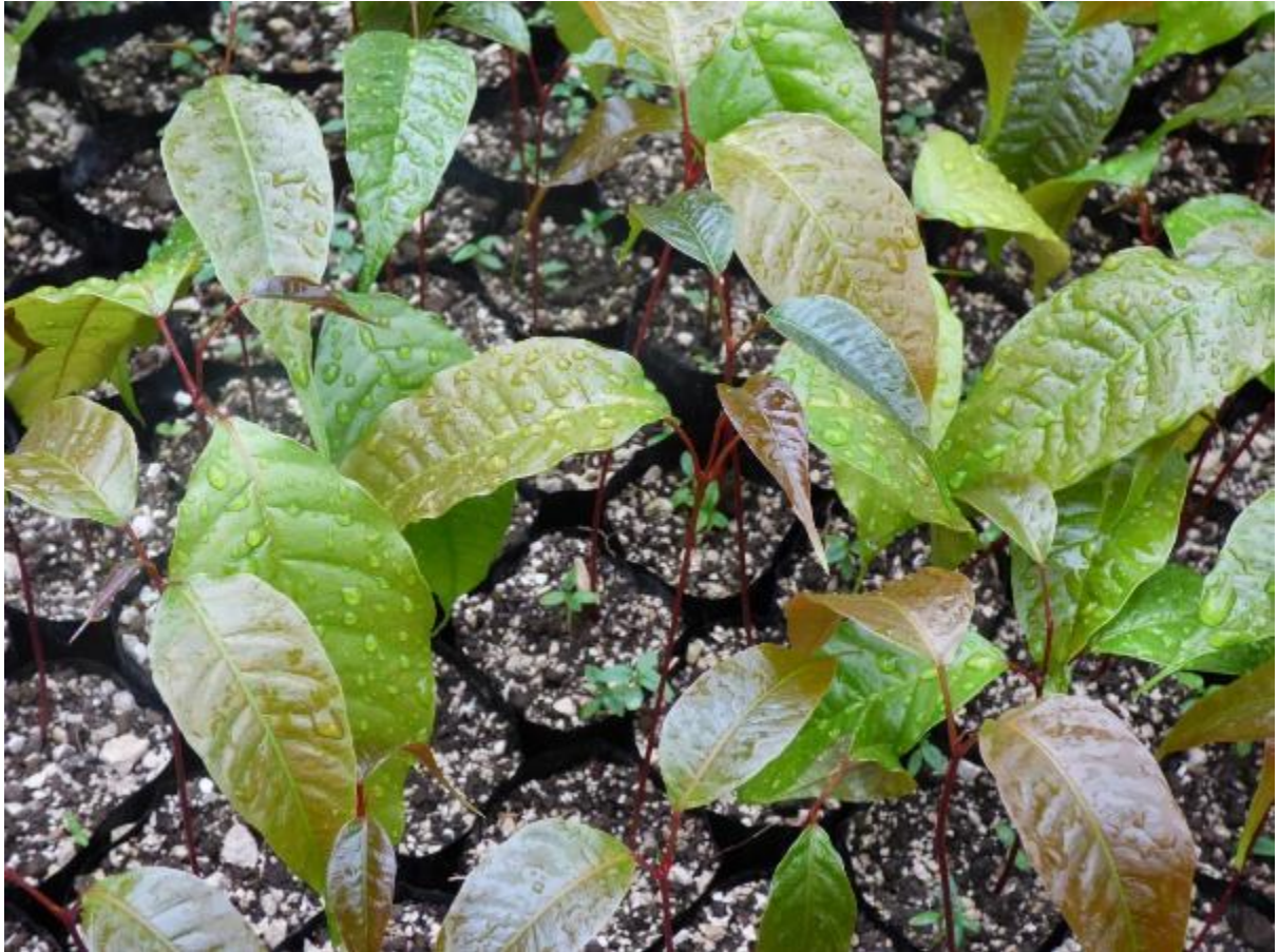
Ilustración 51. Plántulas de T. mexicana .