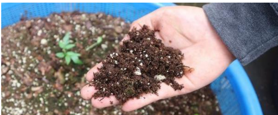
Ilustración 25. Sustrato de siembra compuesto por peat-moss y tepezil.

El sustrato de siembra preparado en el Vivero BMM está compuesto por un 60% de 'peat-moss' (mezcla de turba) y un 40% de tepezil (fragmentos de piedra pómez): el 'peat-moss' favorece la aireación del sustrato y la retención de agua y nutrientes; el tepezil contribuye al drenaje del sustrato (II.25). El sustrato para el crecimiento de las plántulas se pone en las bolsas de vivero, dónde las plantas vienen después trasplantadas: en este caso la composición es un poco diferente, pues se utiliza directamente la tierra del bosque mezclada con tepezil. A veces se ha utilizado arena, sola o con tepezil. En otros viveros se utilizan también otros compuestos, como los productos del lombricompostaje, restos de café, o aserrín: esencialmente lo que esté disponible y que se adapte a las condiciones de cada vivero.