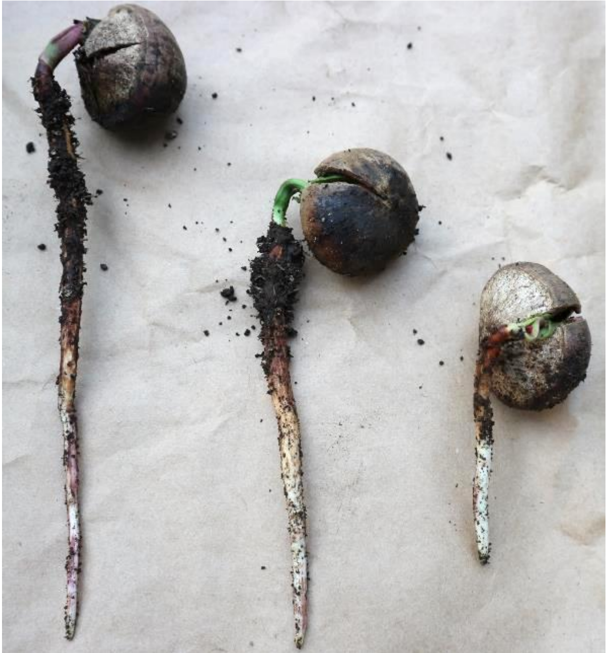
Ilustración 18. Diferentes estadios de crecimiento de las radículas de las semillas de Q. insignis .