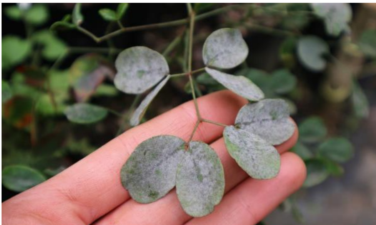
Ilustración 28. Infección de oidio en las hojas de una plántula de Tara cacalaco (Bonpl.) Molinari & Sánchez Och.