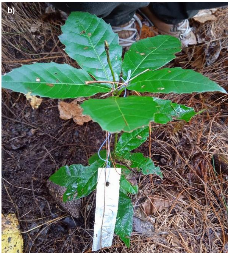
Ilustración 49. Plántula de Q. xalapensis : a) en vivero (Lucero García © PVER); b) trasplantada en campo (F. Vázquez C. / © PVER).