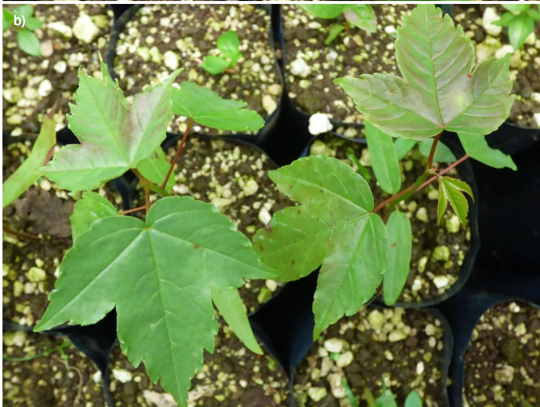
Ilustración 32. Plántulas de C. vitifolium : a) recién trasplantadas del semillero a la bolsa; b) más desarrolladas y con diferente forma de las hojas.