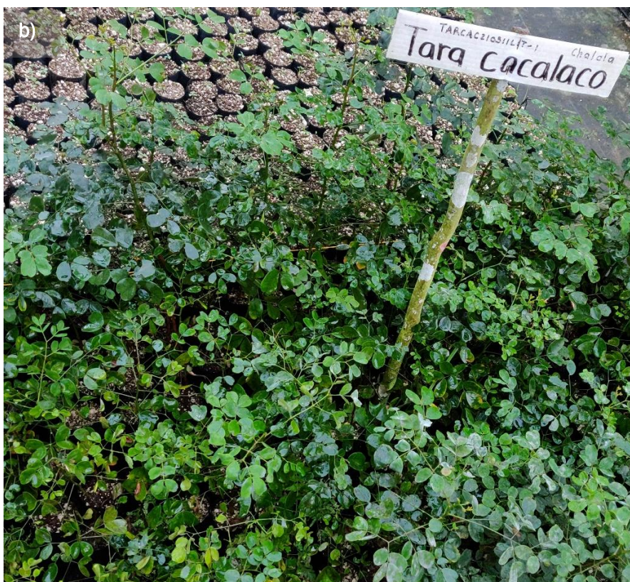
Ilustración 52. Plantulas de T. cacalaco : a) plántulas antes del trasplante; b) plántulas mas desarrolladas y trasplantadas.