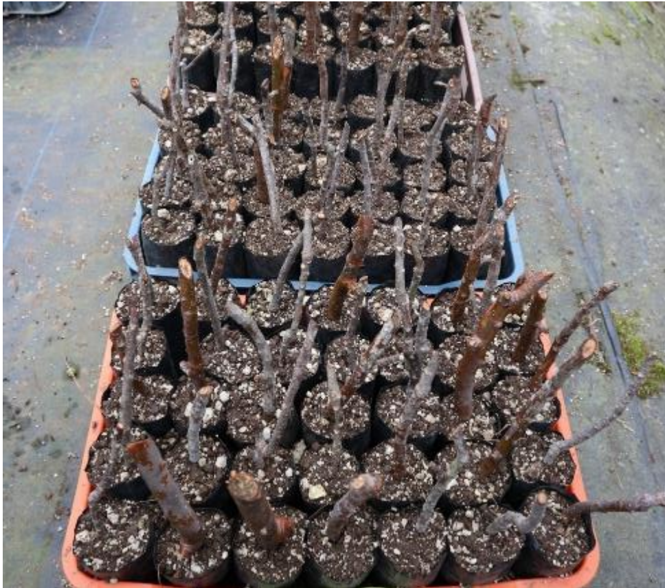
Ilustración 24. Estacas de B. simaruba en el Vivero BMM.

En casi todos los casos, en el Vivero BMM las plantas se propagan a partir de las semillas, aunque a veces se practican ‘estacas’ (acodos aéreos – Il.24), pero con especies arbóreas como Bursera simaruba (L.) Sarg. (‘palo mulato’) que se utiliza como cerca viva, y que entonces no necesita tener mucha diversidad genética.