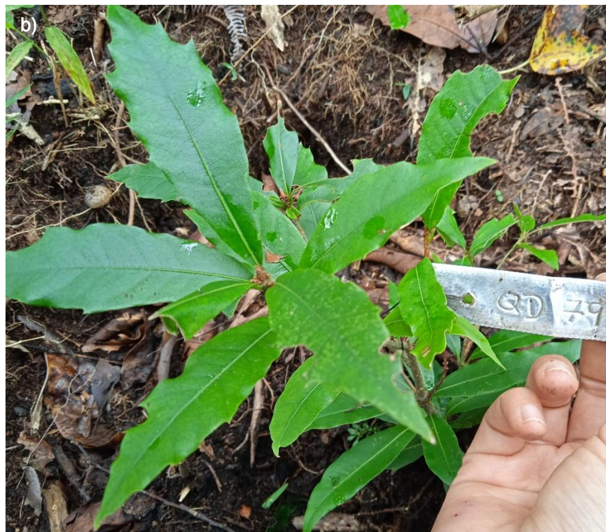
Ilustración 46. Plántula de Q. delgadoana : a) recién trasplantada en vivero; b) plántula más desarrollada, trasplantada en campo.