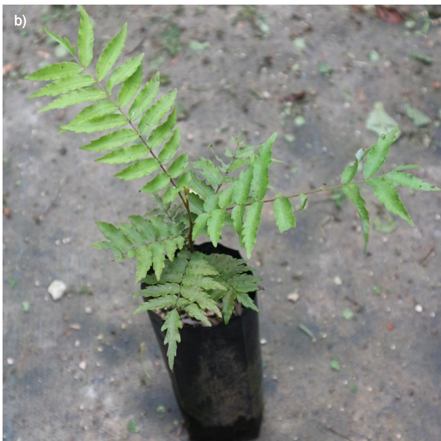
Ilustración 44. Plántulas de O. mexicana : a) plántulas recién trasplantadas, aún con la típica coloración rojiza; b) plántula un poco más desarrollada.