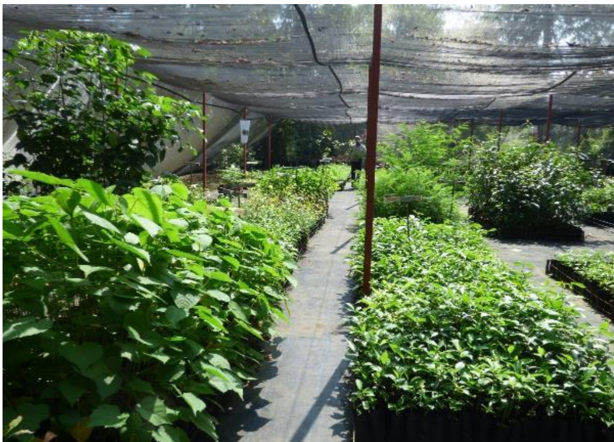
Ilustración 4. Área principal de trasplante y propagación en el Vivero BMM.