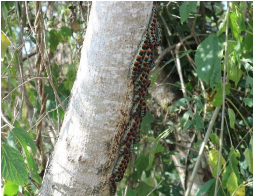
Ilustración 37. El 'gusano del Jonote' sobre un árbol de H. appendiculatus .