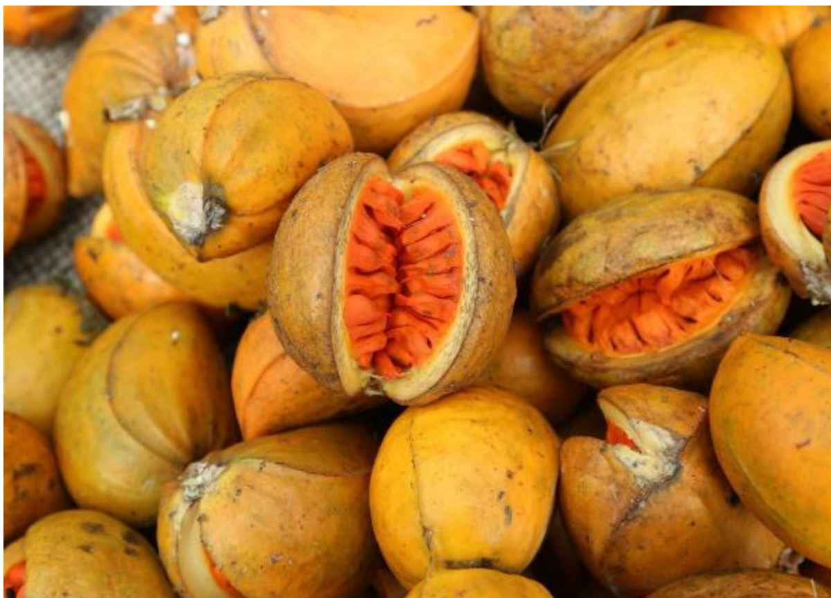
Ilustración 10. Frutos de T. litoralis en diferentes estadios de maduración.

La II.12 muestra las semillas de T. litoralis limpiadas y secadas, como también un ejemplo de pruebas de corte de una semilla sana y de una no vital, que se distinguen por el color externo e interno (semilla sana = oscura por fuera y blanca por dentro; semilla no vital = clara por fuera y oscura por dentro).