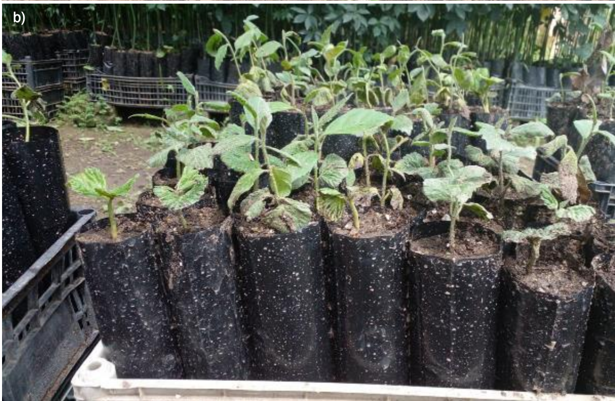
Ilustración 33. Plántulas de Cordia dodecandra A. DC.: a) plántulas en las primeras fases de crecimiento, antes de ser trasplantadas; b) plántulas más desarrolladas.