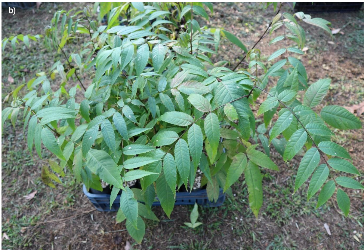
Ilustración 40. Plántulas de J. pyriformis : a) plántula de 15–20 cm, casi lista para el trasplante; plántulas más desarrolladas, listas para la donación.