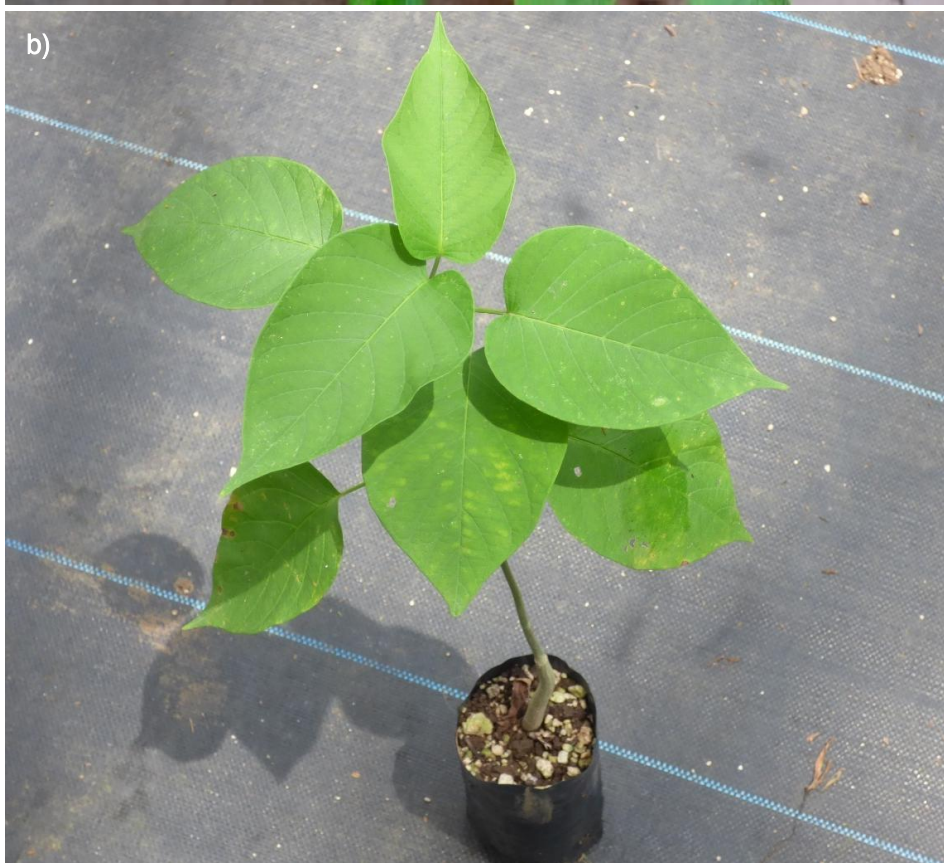
Ilustración 39. Plántulas de I. wolcottiana : a) plántulas antes del trasplante; b) plántula más desarrollada.