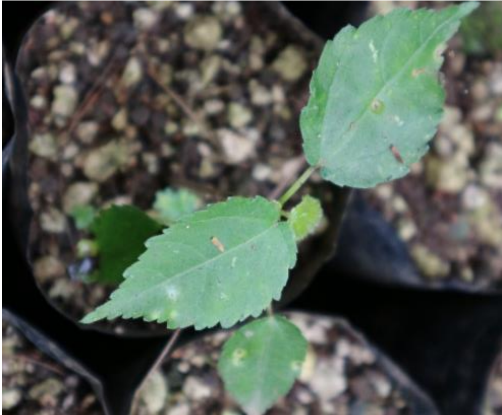
Ilustración 36. Plántula de H. donnellsmithii .