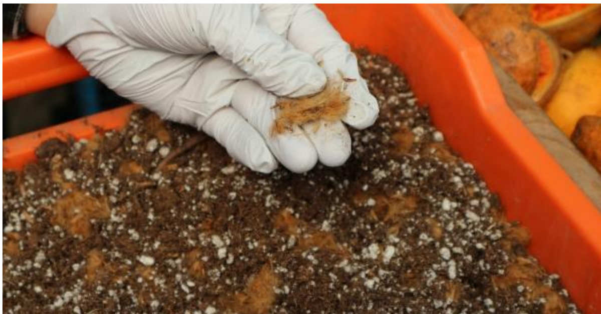
Ilustración 14. Ejemplo de especie a la que no se hace la prueba de flotación: semillas de P. wrightii con vellosidades en evidencia.

géneros cuyas semillas no se lavan ni se incluyen en pruebas de flotación son C. odorata ; Clethra mexicana DC. ('jaboncillo'); Handroanthus Mattos ('guayacán'); Heliocarpus L. ('jonote'); Liquidambar L. ('liquidambar'); Oreomunnea mexicana (Standl.) J.-F. Leroy ('caudillo'); Platanus wrightii S. Watson (ex Platanus mexicana Torr., 'álamo blanco' - Il.14); Tabebuia Gomes ex DC. ('amapes'); Tecoma stans (L.) Juss. ex Kunth ('algodoncillo' - Il.15).