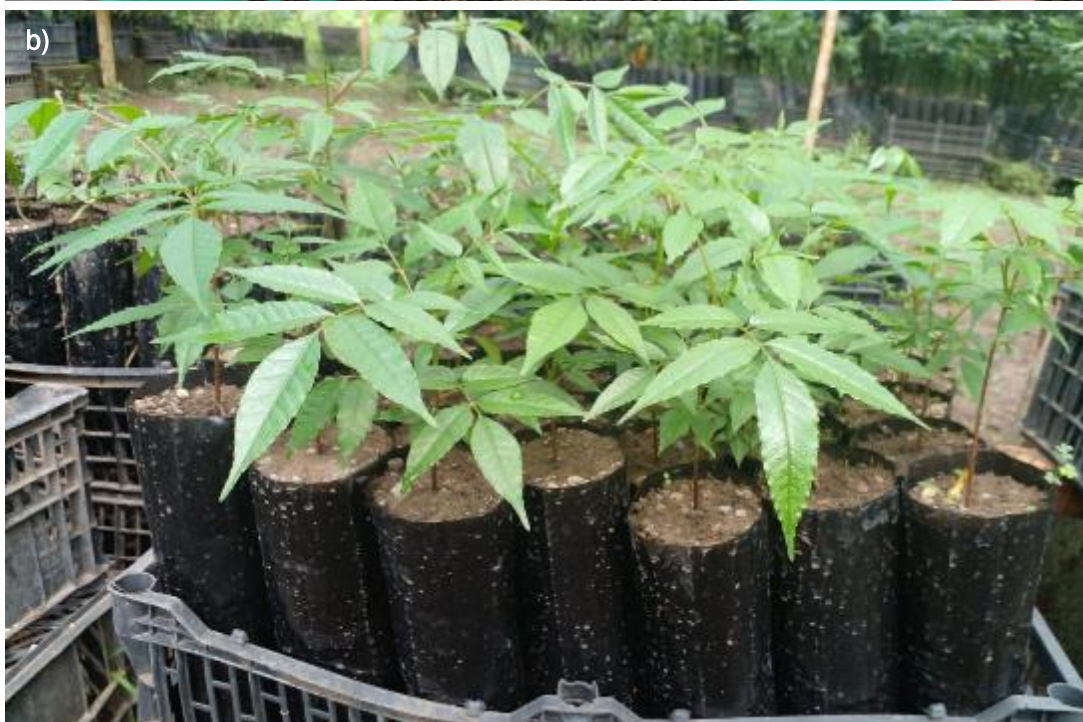
Ilustración 50. Plántulas de S. mombin : a) plántulas jóvenes antes del trasplante (Silvia Bacci / © RBG Kew); b) plántulas trasplantadas y listas para la donación (A. Chaga / © PVER).