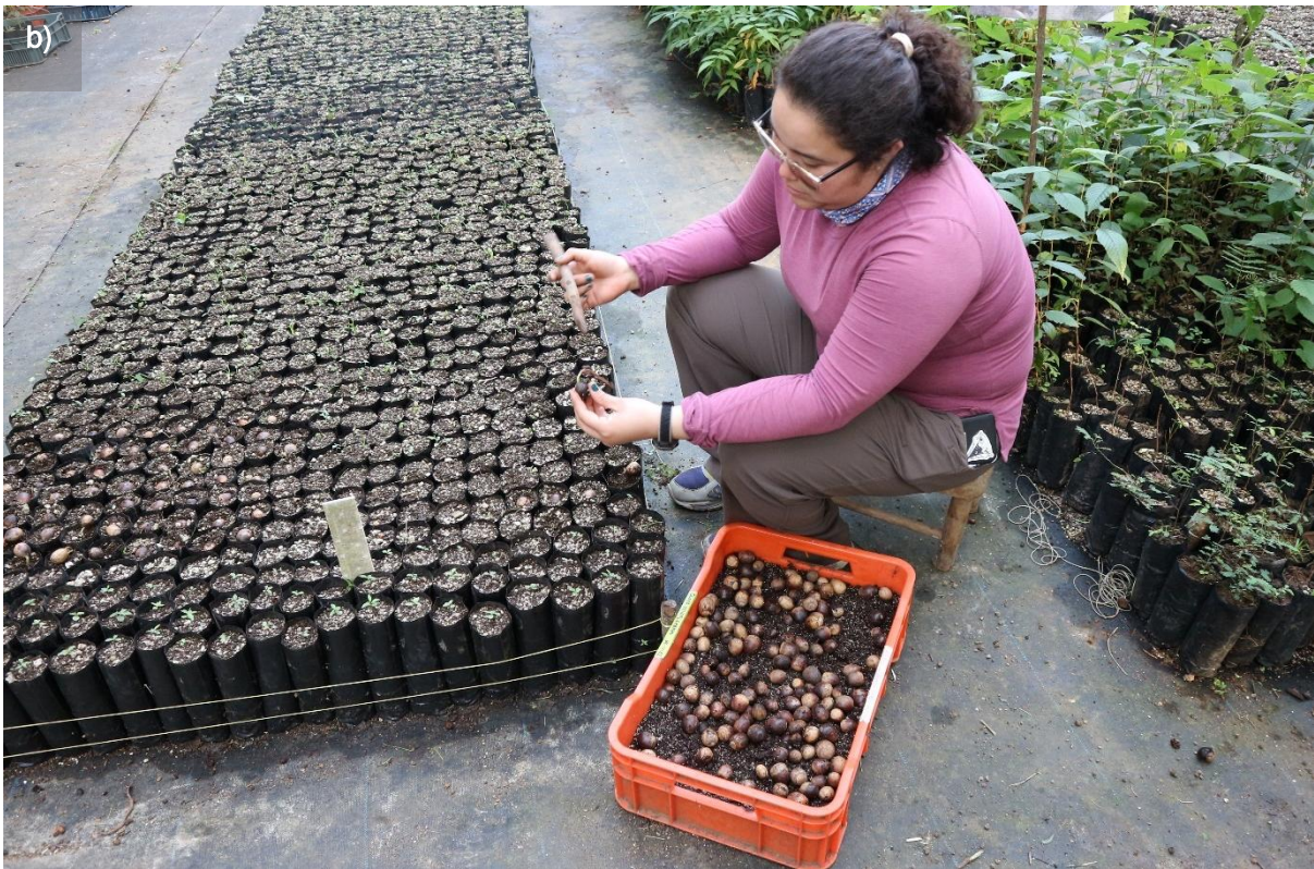
Ilustración 22. Trasplante con estacas de Staphylea insignis (Tul.) Byng & Christenh. (ex Turpinia insignis (Kunth) Tul.).