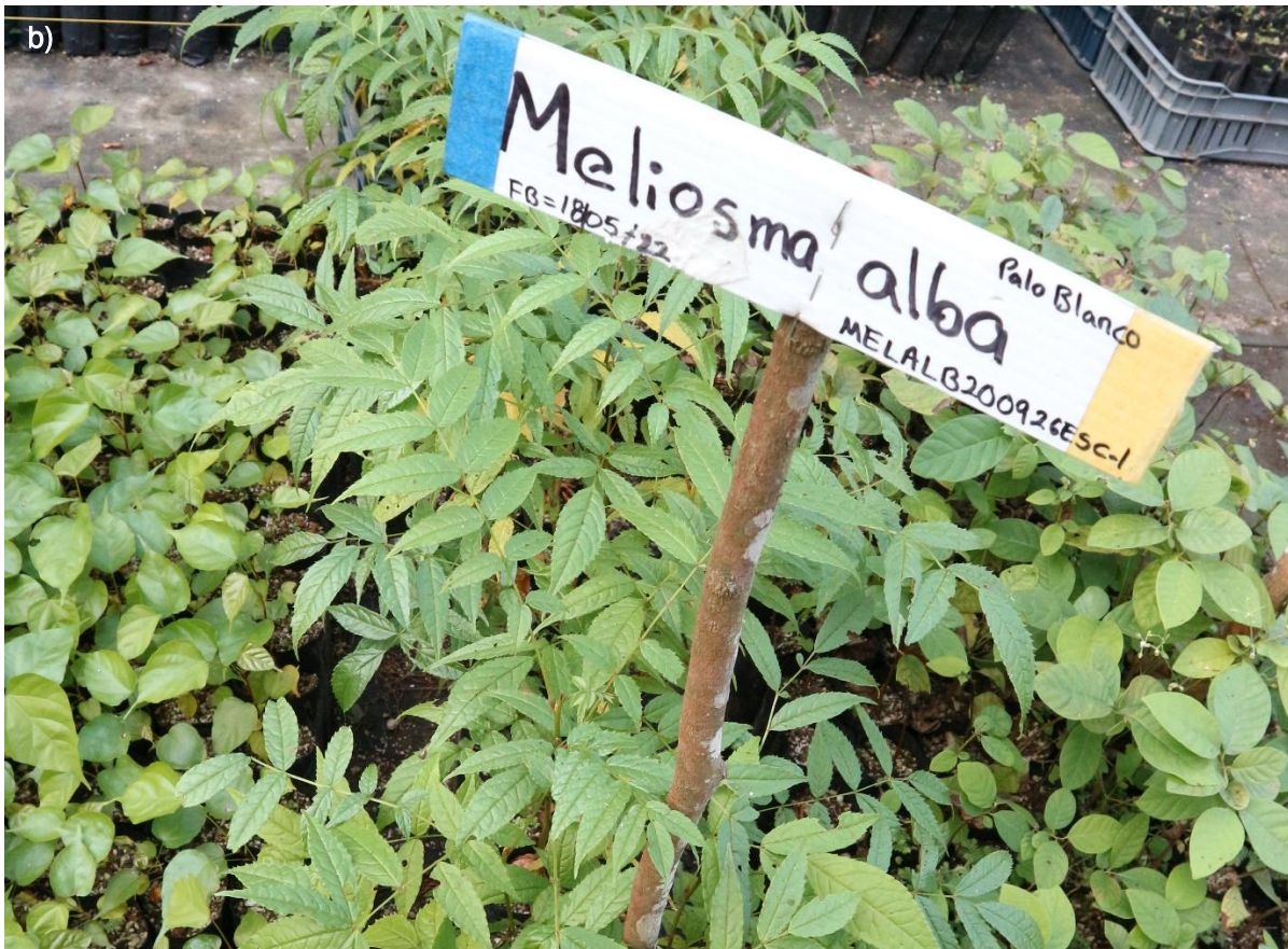
Ilustración 42. Plántulas de M. alba : a) emergencia reciente de plántulas; b) plántulas desarrolladas y trasplantadas.