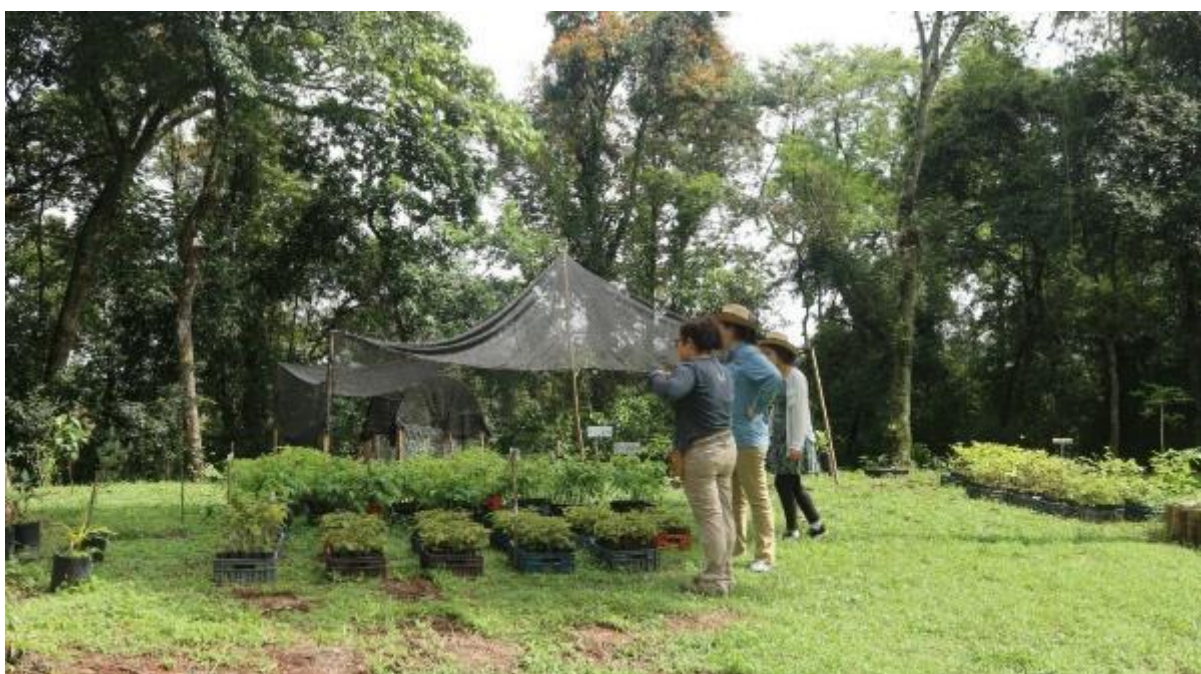
Ilustración 5. Área soleada del Vivero BMM donde se mantienen las plántulas de especies de climas más cálidos.