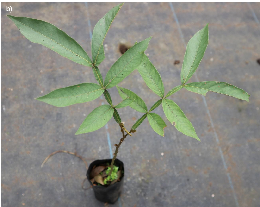
Ilustración 38. Plántulas de L. vera : a) plántula joven de color rojizo; b) plántula más desarrollada.