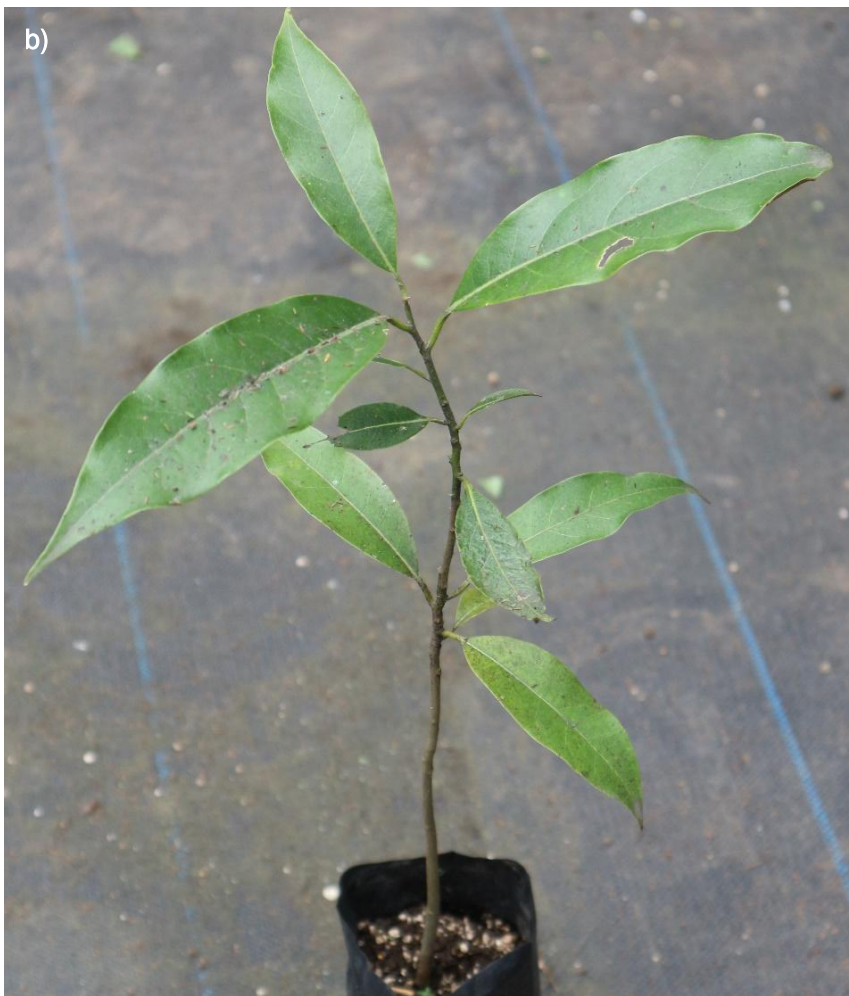
Ilustración 43. Plántulas de O. disjuncta : a) plántula antes del trasplante; b) plántula después del trasplante.