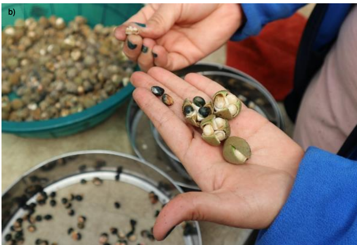
Ilustración 9. Frutos y semillas de H. integerrima : a) frutos antes de ser limpiados; b) Lucero García enseñando la diferencia entre semillas maduras (negras con fibras rojizas) e inmaduras (blancas con fibras blanco-verdes).