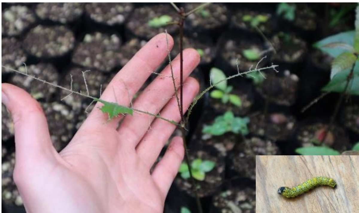
Ilustración 27. Ejemplo de daño causado a las hojas de unas plántulas por una larva de lepidóptero (especie no identificada), mostrada en la parte baja derecha de la imagen.