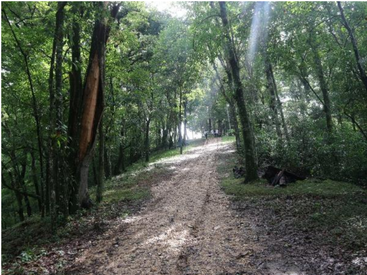
Ilustración 1. Parcela de Bosque Mesófilo de Montaña en el sendero que lleva en el Vivero BMM.:

El Vivero BMM se encuentra también en un cerro, al pie del cual hay un lago que se utiliza para abastecer el agua para el mismo vivero (II.2).