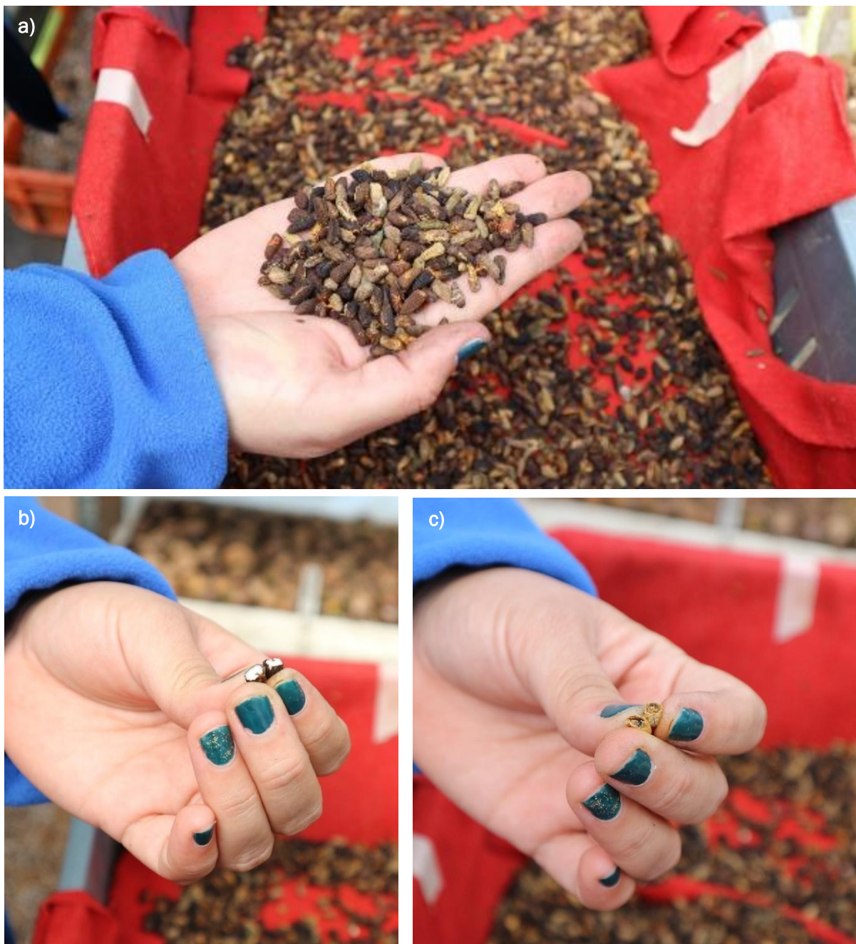
Ilustración 12. Semillas de T. litoralis lavadas y secadas: a) detalle general que muestra semillas diferentes colores; b) sección de semilla vital (oscura por fuera y blanca por dentro); c) sección de semilla no vital (clara por dentro y oscura por fuera).