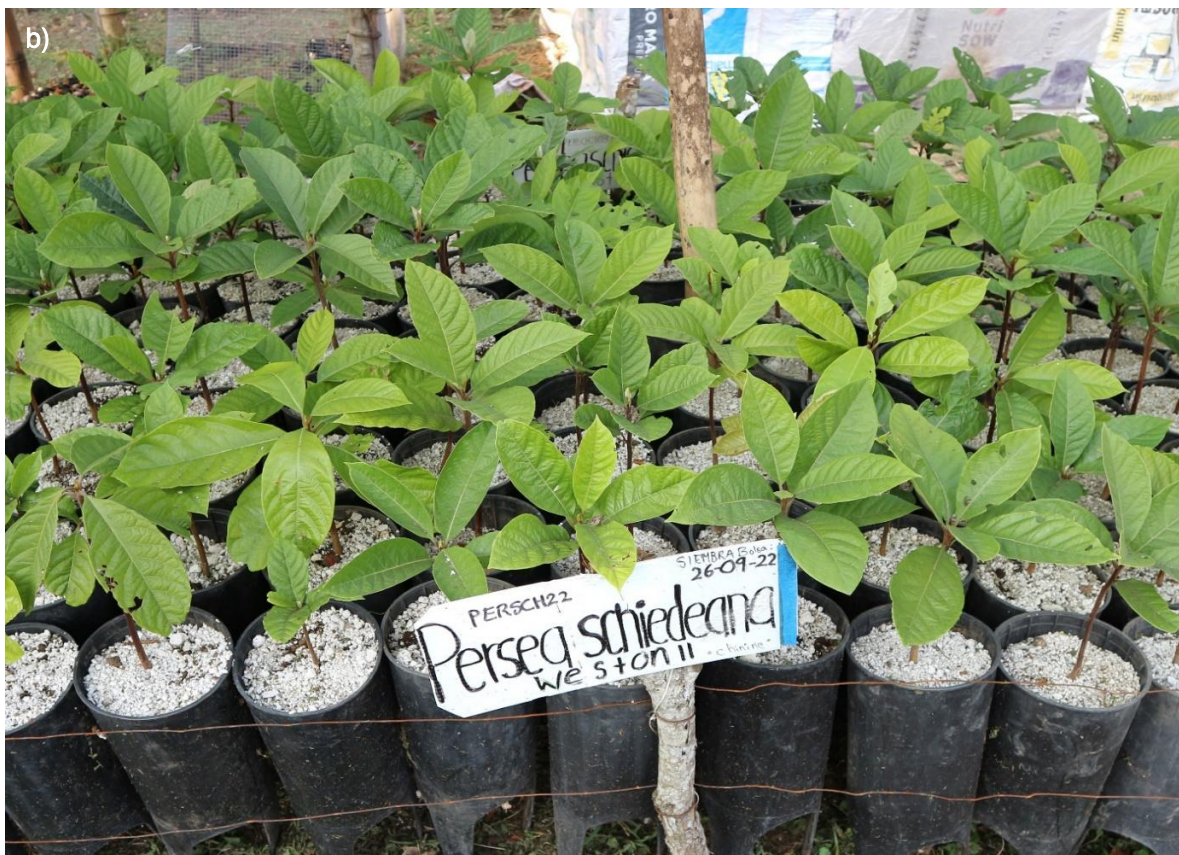
Ilustración 45. Plántulas de P. schiedeana : a) plántulas apenas trasplantadas en tubetes, con Ana Zamora en la foto (Lucero García / © PVER); b) plántulas más desarrolladas, casi listas para la donación (Silvia Bacci / © RBG Kew).