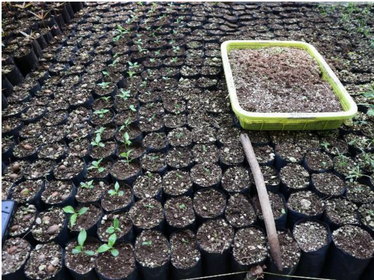
Ilustración 21. Trasplante con estacas de Staphylea insignis (Tul.) Byng & Christenh. (ex Turpinia insignis (Kunth) Tul.).

Cuando las jóvenes plántulas trasplantadas en las bolsas se mueren o vienen depredadas, se 'repica' con nuevas plántulas, o sea se llenan los huecos dejados por las plantas precedentes con nuevas plántulas.