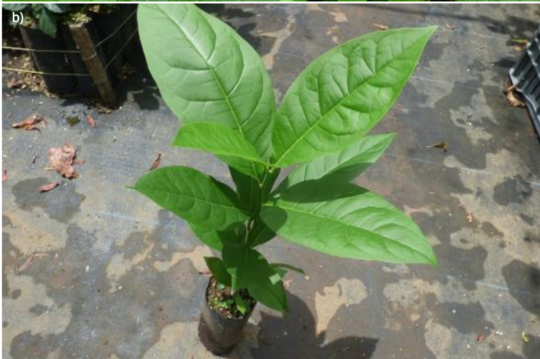
Ilustración 34. Plántulas de E. tinifolia en diferentes fases de crecimiento: a) plántulas antes de ser trasplantadas; b) plántulas trasplantadas.