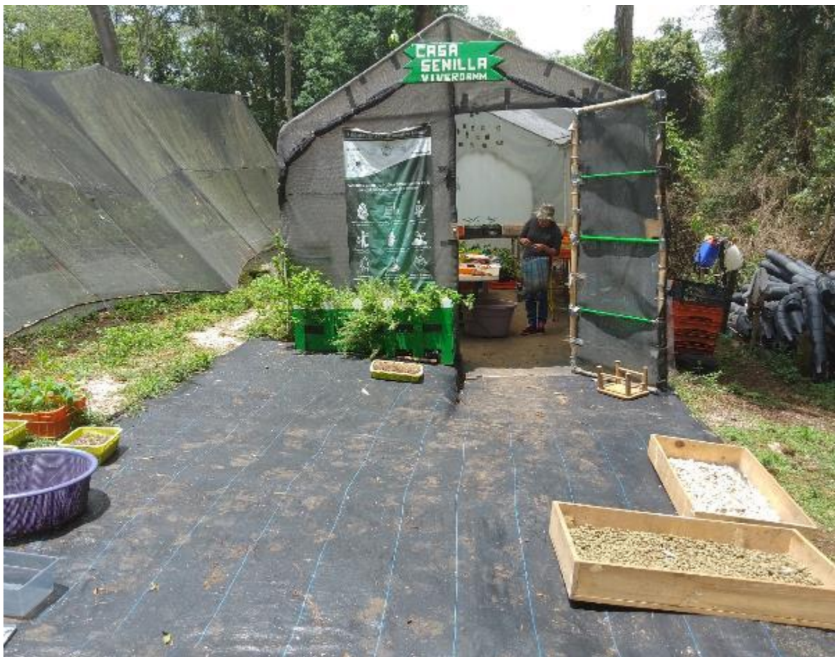
Ilustración 3. El invernadero ‘Casa Semilla’ del Vivero BMM.

Las semillas que llegan al Vivero BMM son en mayor parte recolectadas por el equipo de colectores de Pronatura Veracruz: si las semillas no sobreviven a la desecación y a bajas temperaturas, condiciones necesarias para conservarlas a largo plazo, significa que son ‘recalcitrantes’, y entonces se llevan luego en el Vivero BMM para ser propagadas. Si las semillas pueden ser almacenadas, se conservan en la Reserva de Semillas (RESEM) de Pronatura Veracruz, que constituye una importante fuente de semillas para el Vivero BMM. La RESEM fue instituida en el 2015 con el objetivo de coleccionar y almacenar germoplasma nativo de los ecosistemas de Veracruz, y actualmente almacena cerca de tres millones de semillas de 56 especies, principalmente de BMM y selva baja caducifolia.