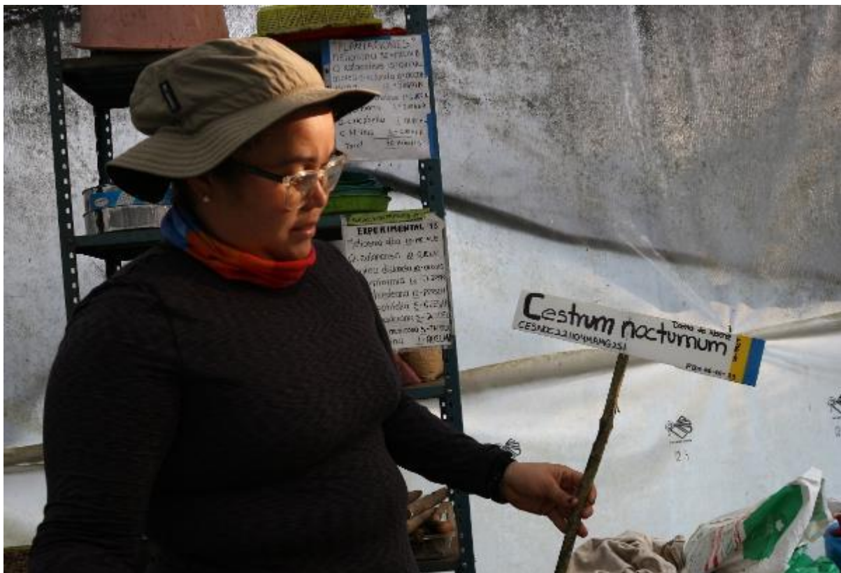
Ilustración 7. Ejemplo de letrero del Vivero BMM: nombre científico, nombre común, acrónimo, Fecha de Bolsa (FB), y citas coloradas.

de reforestación del proyecto Weston (WP5); verdes si son plantas reservadas para la donación a cafetaleros, o si son aptas para ser plantadas en cafetales de sombra; rojas si se trata de plantas exóticas.