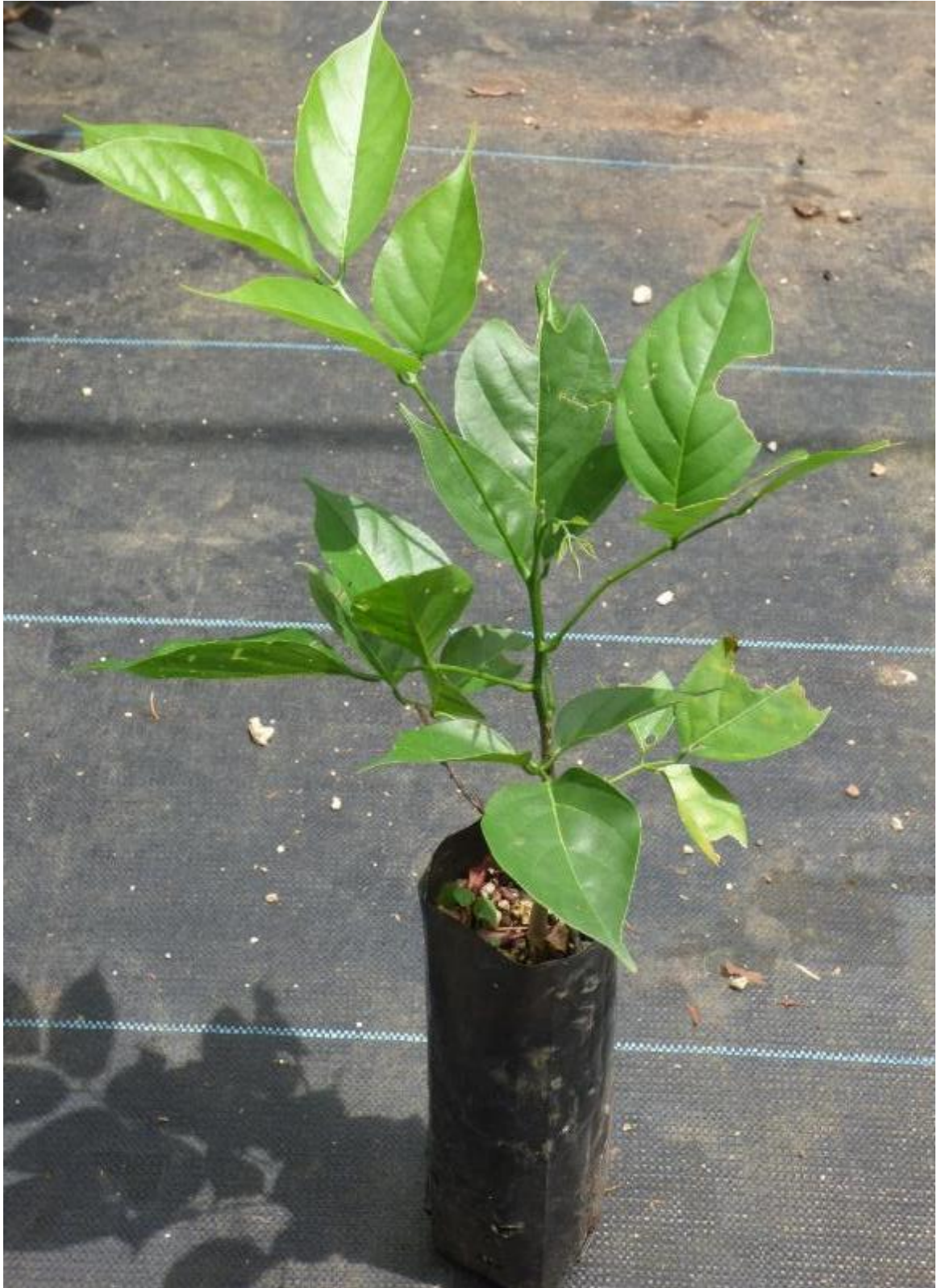
Ilustración 41. Plántula de L. guatemalensis después del trasplante.