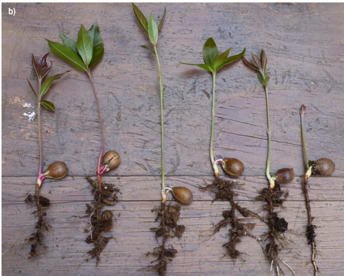
Ilustración 48. Plántulas de Q. sapotifolia : a) antes del trasplante en bolsa; b) diferentes estadios de crecimiento de plántulas.