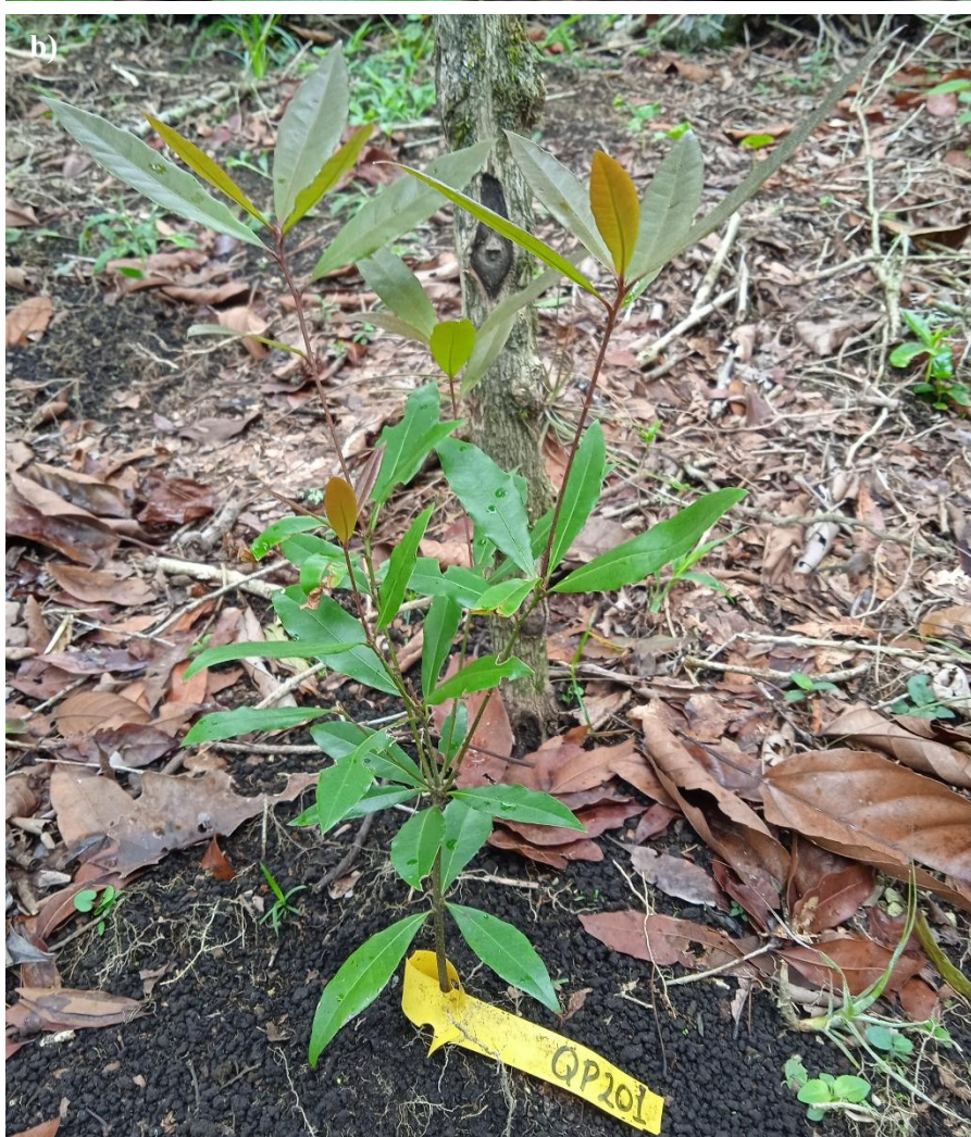
Ilustración 47. Plántula de Q. pinnativenulosa : a) recién trasplantada; b) plántula más desarrollada trasplantada en campo.