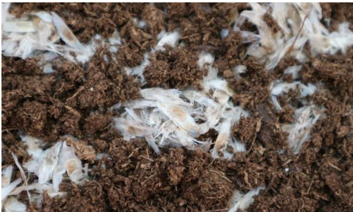
Ilustración 15. Ejemplo de especie a la que no se hace la prueba de flotación: semillas de T. stans con alas en evidencia.