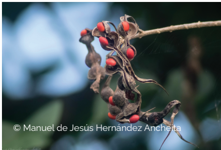
© Manuel de Jesús Hernández Ancheita

Miden entre 11 mm y 16 mm de largo. La cubierta es color rojo escarlata, lisa y brillante. Contiene compuestos tóxicos.